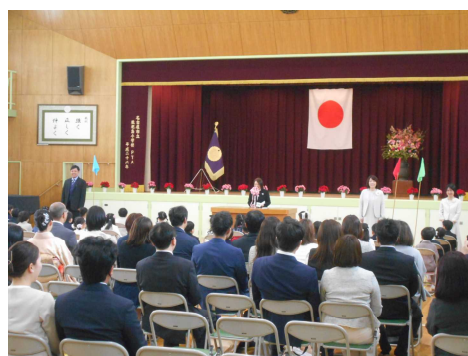
【入学式での1年生の様子】

令和6年度が始まりました。8日には入学式を行い、54人の子どもたちが、枇杷島小学校に入学してきました。1年生は笑顔で体育館に入場し、目を輝かせて、校長先生の話聞くことができました。